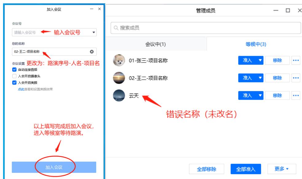
图 1：腾讯会议操作演示